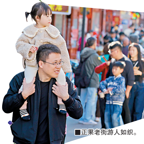
■正果老街游人如织。