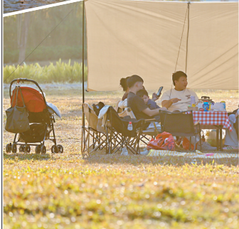
■正果驿站户外露营区。