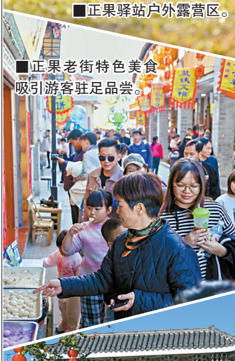
■正果老街特色美食吸引游客驻足品尝。