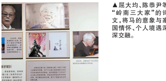
▲屈大均、陈恭尹等“岭南三大大家”的诗文,将马的意象与家国情怀、个人境遇深深交融。