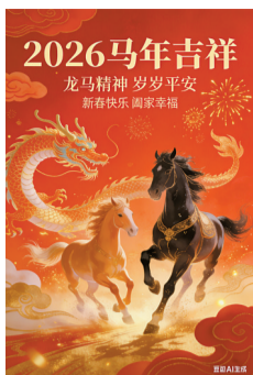
用户用AI生成的拜年海报。