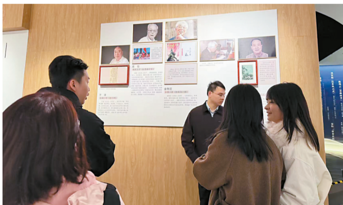
马年新春,年轻人在广东文学馆与粤地文人的骏马相遇。

《过昭关》中“萧条半生事,驱马行中原。人影乱马蹄,蹴踏沙尘昏”,将马的身影与自身飘零境遇紧密相连,骏马踏尘载着诗人穿行中原,深藏漂泊的悲凉,