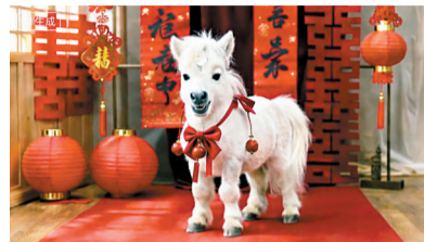
AI生成的会鞠躬拜年的小马视频截图。

过年的温情,藏在一句句真挚的祝福里,可总有人因不善表达、时间紧迫,或是担心措辞不够得体,在送出祝福时犯了难。AI的普及为这种困境解了围——只需输入简单的心意关键词,或是用几句话表达朴素的想法,AI便能快速生成风格多样的祝福,或温情细腻,或俏皮活泼,还能精准适配亲友、长辈、同事等不同对象。