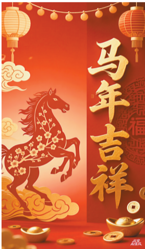
用户用AI生成的拜年海报。

“过去制作一个精美的拜年视频需要懂剪辑、会写脚本,现在的AI技术让这个变得非常简单。”广州市政协委员、广州市科协委员徐强留意到AI拜年这一现象,在接受新快报记者采访时如是说。他指出,很多AI工具支持“一句话”生成拜年视频。市民只需要输入想法(比如“想要一个运动风的马年视频”),AI就能自动完成脚本拆解、画面绘制、配音配乐的全过程,无需任何专业技能。上传一张个人或家庭的静态照片,AI就能让照片里的人“动”起来,说话、唱歌,甚至生成全家福动画,让祝福形式从单一的文字、图片升级为生动的视频;还能解决“词穷”困扰,让大家在5分钟内搞定给多个亲友的差异化祝福,大大减轻心理负担。