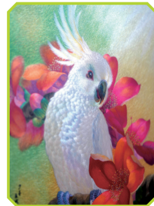
广绣作品鹦鹉与木棉花。