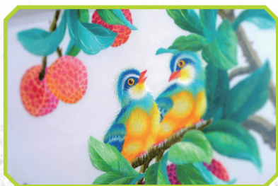
一针一线勾勒出栩栩如生的画面。