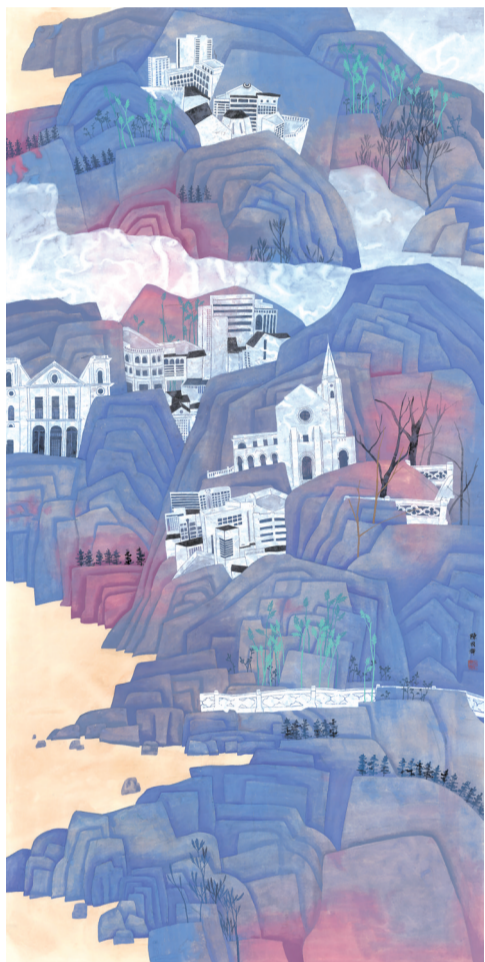
■陈国辉 意象澳门:幽海湛露 2025