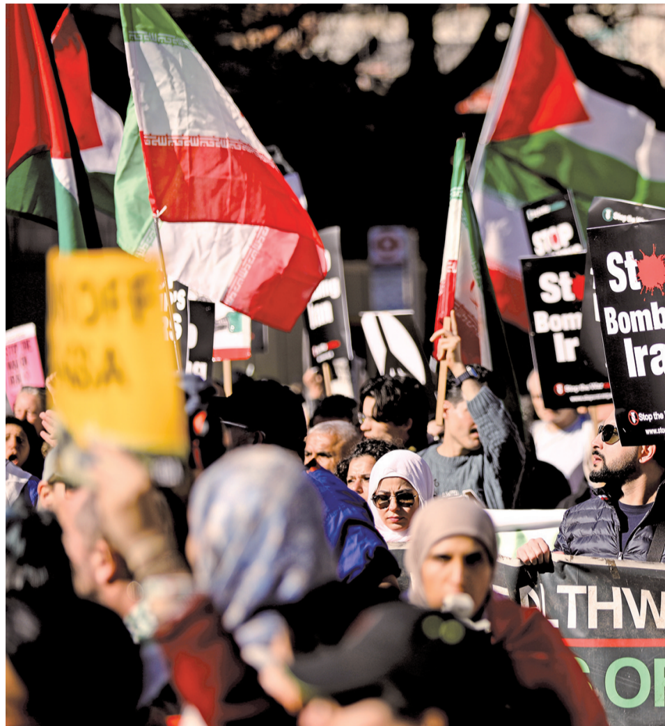
■3月21日，人们在英国伦敦参加集会，抗议美国和以色列对伊朗发动军事打击。