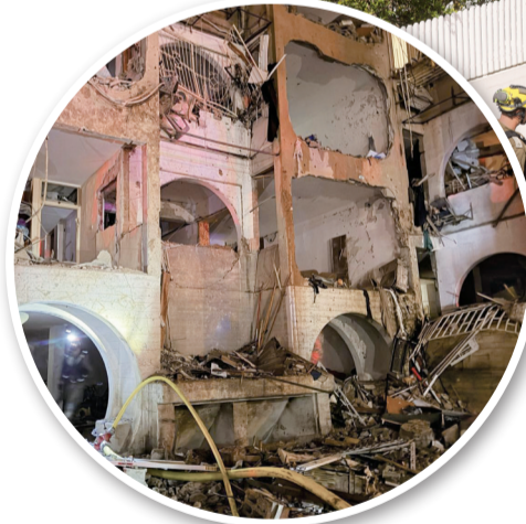
■这是3月21日晚在以色列南部城市阿拉德拍摄的一处导弹袭击点(手机照片)。

国际原子能机构21日证实，已收到以伊双方关于上述袭击的报告，内盖夫核研究中心暂无受损迹象，该地与伊朗纳坦兹