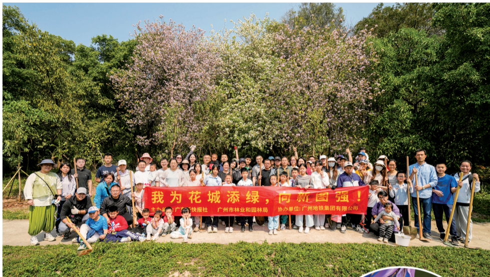
■去年的“我为花城添绿”免费认种活动受到市民热烈欢迎。

本次活动延续多年公益初心,以绿美花城、香满羊城为理念,精心选用桂花树、红绒球两大优质乡土观赏花木,花香浓郁、花姿艳丽,适配广州气候,易成活、观赏性强,既能扮靓城市景观,又能传递美好寓意,让四季花香萦绕花城。