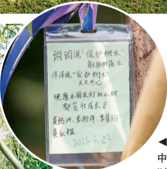
◀小朋友在卡片中写下心愿——“茁壮成长”。