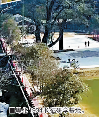
■粤北 1934 长征研学基地。