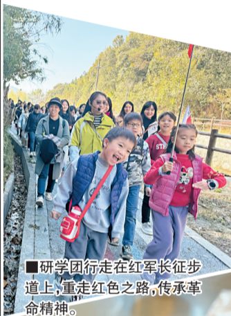
■研学团行走在红军长征步道上,重走红色之路,传承革命精神。