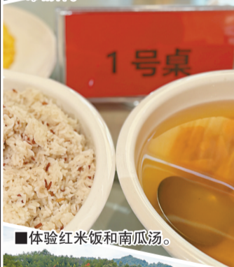
■体验红米饭和南瓜汤。