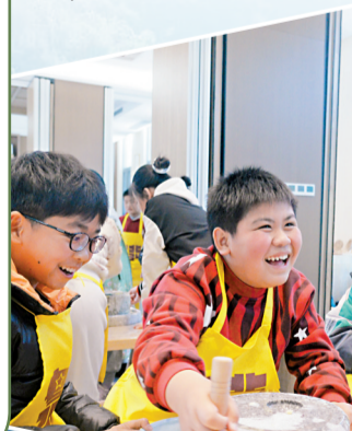
■研学团体验石磨手工,感受传统技艺乐趣。

客家酿豆腐、梅菜扣肉、白切鸡等粤北特色菜肴,口味地道;腊肠、腊猪脚、腊肉、腊鱼等粤北腊味,风味独特;非遗白毛茶清澈鲜爽,回甘悠长。