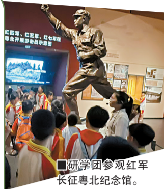
■研学团参观红军长征粤北纪念馆。

如今,粤北 1934 长征研学农文旅项目已成为粤北农文旅融合标杆,收获游客广泛好评。展望未来,项目将继续拓展农文旅融合领域,加强区域产业合作,持续完善联农带农利益联结机制,让城口镇这片红色热土焕发更强生机与活力。