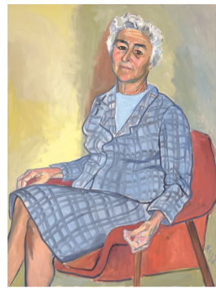
■爱丽丝·尼尔(Muriel Gardiner Butt-inger)101.7×76.3cm 油彩 画布 1966作