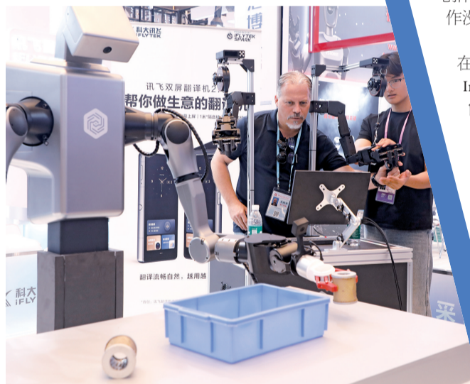
■第138届广交会上,机器人专区受到国内外采购商的热情追捧。