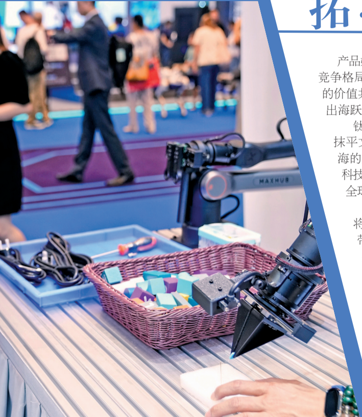
■第138届广交会上,境外采购商全神贯注拍摄智能机械臂操作。

数字浪潮奔涌向前,守正创新还看广东。当前,南粤大地正推动“广东优势”与人工智能深度融合,以数据为舟、以创新为帆出海必将走得更深更远,在智能经济时代,翻篇书写新广货以“智”行天下的又一传奇篇章。