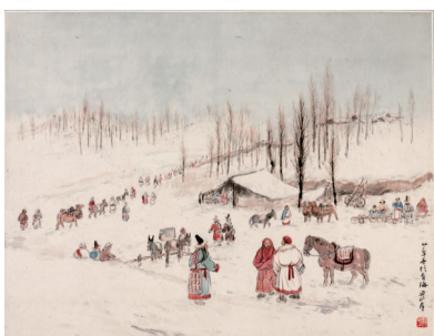
■关山月西北写生:1943年 青海塔尔寺庙会之一,纸本设色,深圳市关山月美术馆藏。