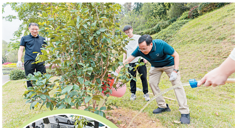
▲众人分工协作植树添绿。