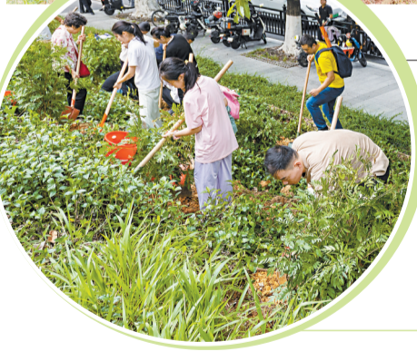
◀大家齐心协力，在人行道旁种下一排小树苗。