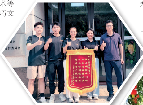
◀ 珠吉街解决群众“急难愁盼”,获群众赠送锦旗。