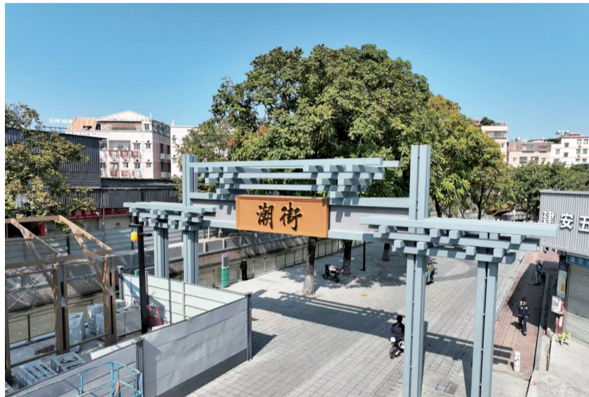
■ 珠吉街正全力推进“珠村潮街”项目建设。

企业有需要,街道有回应。近年来,珠吉街推行“分线分片包干、责任到岗到人”暖企机制,让“企业找上门”变为“服务送上门”,三年累计走访企业超千家,解决融资、人才等诉求236项。