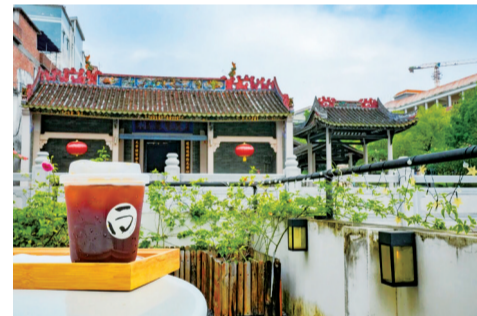
■南宋古建筑里品潮流咖啡。通讯员供图

店内丰富的书籍供人取阅，许多人选择来这度过一个安静的午后，在咖啡和书墨香气中感受艺术的美好。