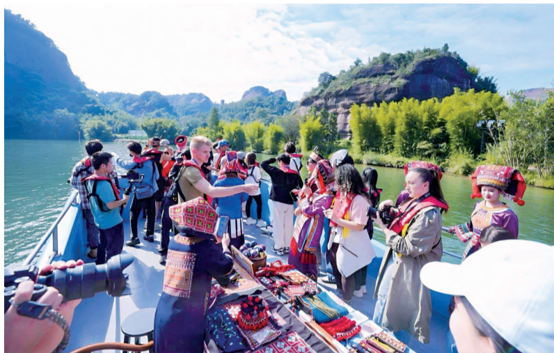
■广东旖旎风光吸引国内外游客到访。