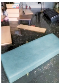
■3月29日15时40分左右,店内水位不断上涨,试鞋凳已经漂浮起来。

针对华乐路此次水浸情况,越秀区建水局回应称,该区域地势低洼,3月29日下午出现短时强降雨,瞬时雨势较大,45分钟平均雨量达75mm,超五年一遇;受下游东濠涌高水位(水位达8.0m)及孖鱼岗渠箱水位(末端水位8.5m)满管顶托影响,现状排水管网过流不及,