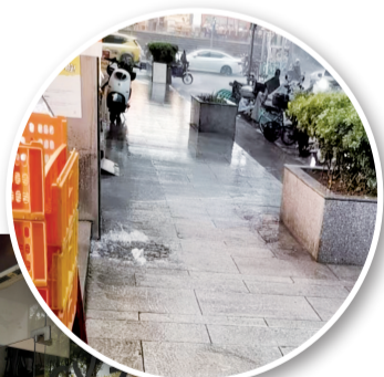
▲3月29日下午暴雨时,该路段下水道及井盖出现“反水”现象。