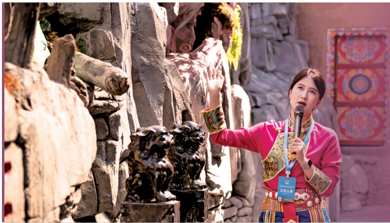
■马尔康查北村民族风情街——嘉绒里。