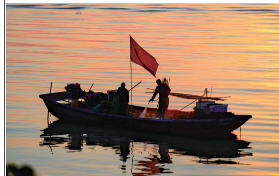
■驻马店宿鸭湖渔船归。

驻马店号称“天下之中”,它的历史镌刻着鲜明的驿站文化印记,是唯一沿用古驿站名命名的地级市,历史上也一直扼中原之“咽喉”,连东都洛阳与江南水乡的必经之路——这就是河南省驻马店,它还有个别名就叫“天中”。