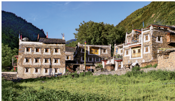
■马尔康特色民居由石头砌成,形似碉楼。