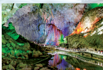
■巴马长寿村百魔洞。

百魔洞是一处雄奇的溶洞,其中的石笋等经过数亿年发育成为千姿百态的结晶,陡峭亦秀丽,阳光穿过洞口,犹如大自然的艺术殿堂,吸引人类