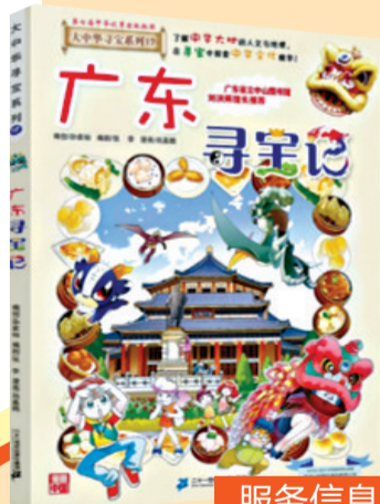
◀最受儿童喜爱的书《广东寻宝记》