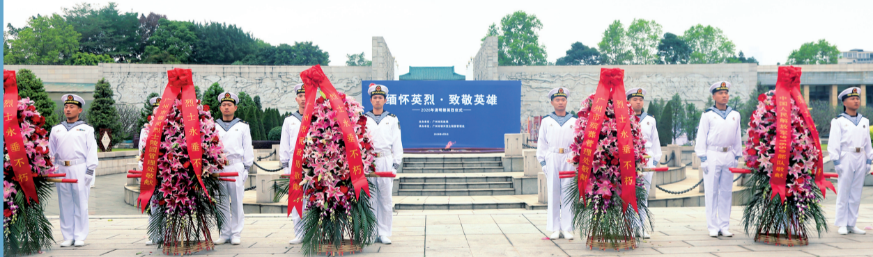
■纪念英烈仪式开始前,现场庄严肃穆。

新快报讯 记者麦婉诗 通讯员汤可欣报道 清明寄哀思,红棉慰忠魂。4月5日清明节当天,广州市民政局在市银河烈士陵园广场举行“英雄花开英雄城”清明纪念英烈活动。党员干部、公安干警、退役军人、在校师生、烈士亲属及社会各界群众代表参加活动,共同追思先烈、致敬英雄。上午10时,仪式正式开始。现场庄严肃穆,全体人员整齐列队,面向木棉花火炬肃穆而立,伴随着雄壮的《义勇军进行曲》,全场齐声高唱中华人民共和国国歌。国歌唱毕,全体人员向革命先烈鞠躬默哀,深切悼念为民族独立、人民解放和国家富强英勇献身的革命先烈。默哀毕,天泽中学20名少先队员献唱《我们是共产主义接班人》,稚嫩而坚定的歌声传递出对先烈的敬仰和继承先烈遗志的决心。《献花曲》奏响,礼兵抬着花篮稳步前行,将花篮摆放至木棉花火炬前。有关