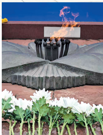
■参加纪念活动的各界代表在木棉花火炬前敬献鲜花。