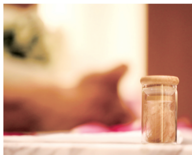
■告别仪式前,主人剪下爱宠的一撮毛发留作纪念。