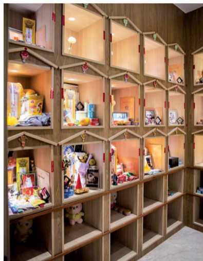
■4月2日,宠物善终馆内的留念区。

面对诸多问题,专业律师建议爱宠人士为宠物选择合适的殡葬服务时,首先要看资质,确认机构持有《营业执照》,经营范围须包含“动物无害化处理”;接着要核对流程,要求商家全程挂宠物专属身份识别牌,明确要求火化全程可监督,亲临现场或索要带时间戳的进炉视频;还要签合同,明确全流程费用明细与双方权责,警惕中途加价和隐形捆绑。