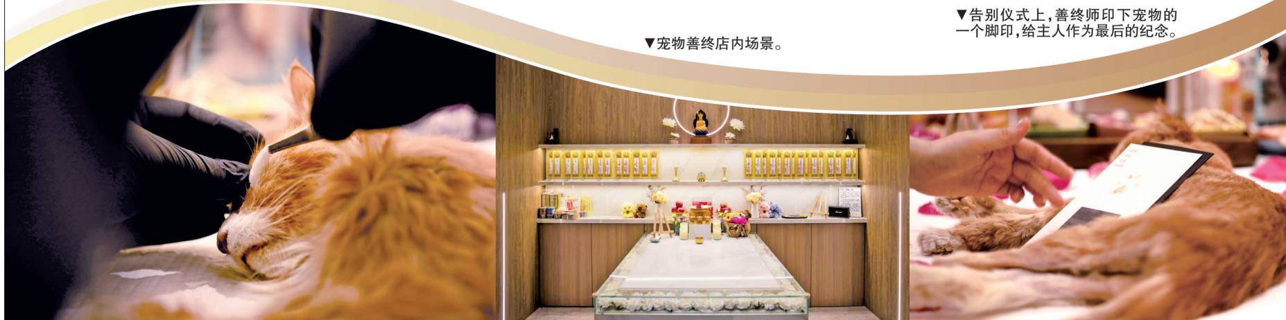
▼告别仪式上,善终师印下宠物的一个脚印,给主人作为最后的纪念。