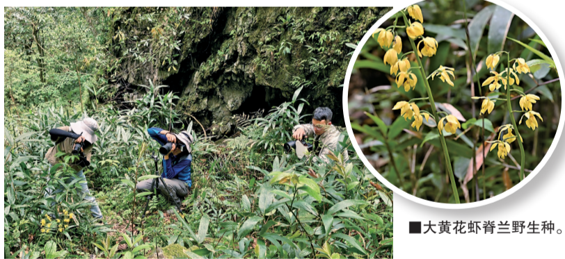
■大黄花虾脊兰野生种。

新快报讯 记者陈慕媛 通讯员陈又生报道 新快报记者近日获悉，中国科学院华南植物园植物分类与多样性研究团队在执行“广东植物多样性全域调查与评估”项目期间，于2026年3月底至4月初在韶关乐昌市南岭地区开展野外调查时，首次在广东省内发现国家一级重点保护野生植物——大黄花虾脊兰的野生种群。