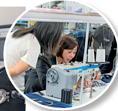
■希音就业帮扶(车缝)技能培训班。

广东省新兴激光等离子体技术研究院则为美妆包装带来创新突破。其研发的国内首条纯国产AR光学镀膜连续线，成本仅为进口设备的一半，可将光学反射率降至0.5%以下。“我们的等离子体镀膜技术，既能让瓶身呈现炫光效果，又能在瓶内壁镀膜，隔水隔氧保护功效成分。”研究院产业基金部副主任郑耿哲说，实现了包装“装饰+功能”双重提升。