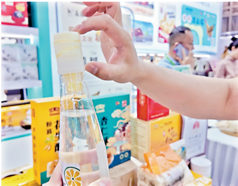
■大量特色食品在展会上亮相。