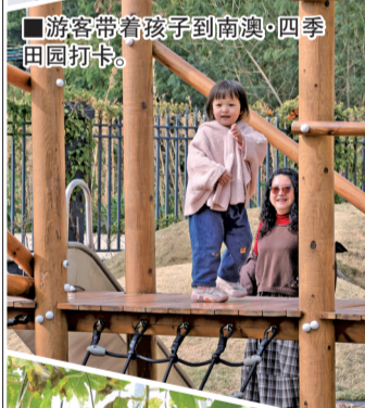
■ 游客带着孩子到南澳·四季田园打卡。