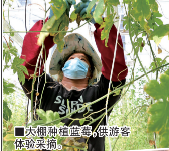
■ 大棚种植蓝莓,供游客体验采摘。