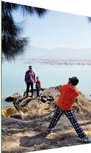
■ 海上养殖生蚝使用的彩色生态浮筒形成“彩虹海”,吸引游客驻足留影。