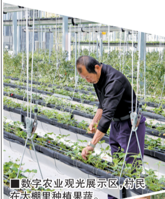
■ 数字农业观光展示区,村民在智能大棚里种植果蔬。