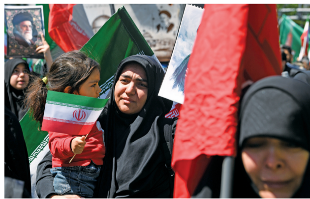
■4月9日,在伊朗首都德黑兰,人们参加悼念活动,缅怀已故伊朗最高领袖阿里·哈梅内伊。

美国专家分析,相较于发动地面行动、更大规模轰炸等进一步升级战事的选项,封锁海峡成为美方剩余手段中更具操作性的一项。美国国内对战争成本及政策方向有着巨大分歧和强烈不满,尤其是如若发起地面行动,或面临“战争泥潭”风险。美国前外交