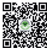
广东公益恤孤助学促进会公众号