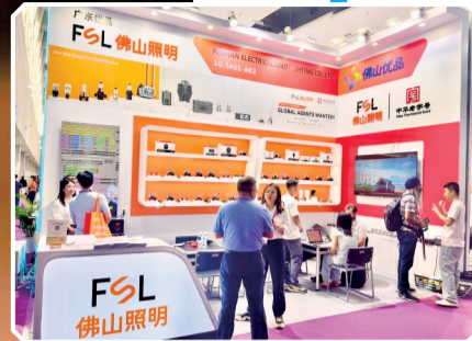
■佛山照明亮相第139届广交会汽车配件展区和照明展区。