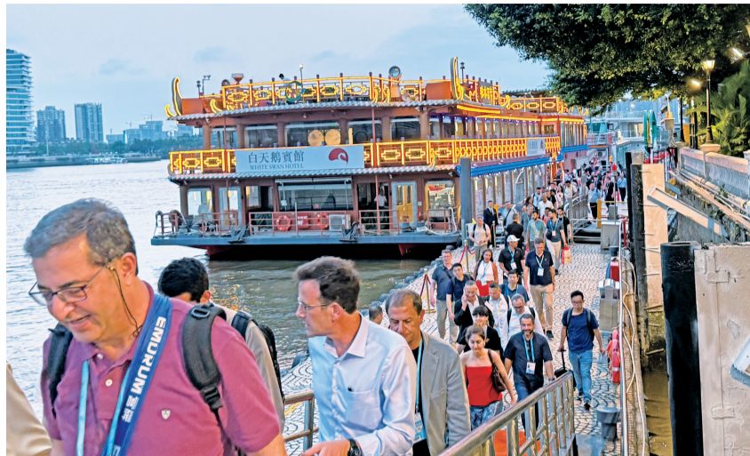
■广交会客商搭乘白天鹅宾馆的水上接驳专线从琶洲回到酒店。

为此,广州文旅市场推出系列创新体验。例如,推出串联近20个地标的双层文旅巴士专线,广州塔举办“人类未来音乐会”及“大湾鸡”IP沉浸式情景剧,cdf广州市内免税店推出广交会来宾专属礼遇等。