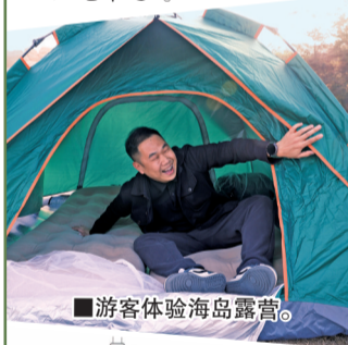
■游客体验海岛露营。

位于江牡岛附近海域的国泰海洋牧场,为游客提供了深海养殖观光的平台,同时,游客可以体验现捕现捞加工的乐趣,品尝到最鲜的“汕尾味道”。