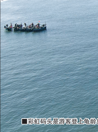
■彩虹码头是游客登上龟龄岛必打卡的网红景点。