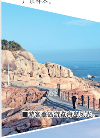
■游客登岛游览海岛风光。