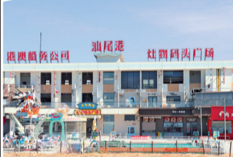
■海港文旅码头附近,灶物码头广场通过盘活闲置资源改造而成。