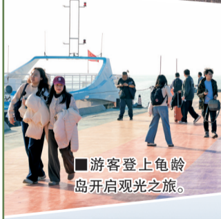
■游客登上龟龄岛开启观光之旅。