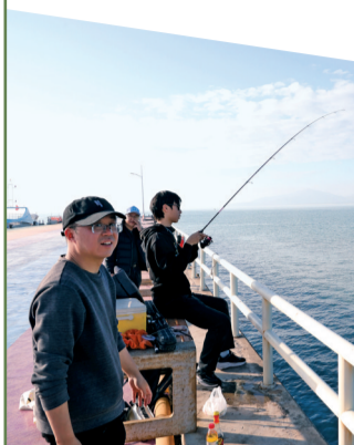
■游客在龟龄岛上体验海钓乐趣。

“在保护中开发,在创新中发展。”杨国辉表示,汕尾将“跳岛游+渔业”农文旅项目入选全省农文旅融合发展优质项目作为新起点,发挥项目示范带动作用,结合不同海岛特点构建完善“跳岛游”产品体系,推动“跳岛游”特色项目提档升级、文旅版图扩容更新,以文旅创新汇聚人气,以卓越体验广传美名,助力滨海文旅实现质的飞跃和量的突破。