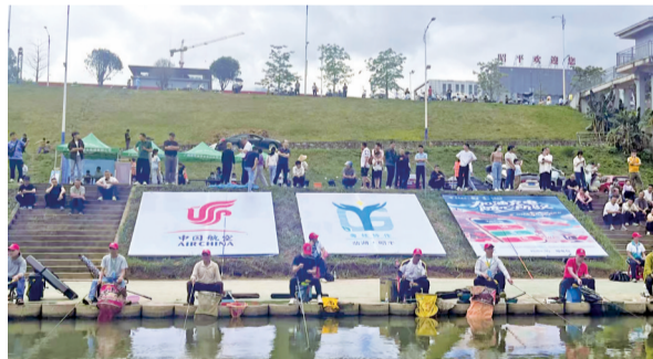
■“茶乡有约·全民渔乐”钓鱼联赛活动现场。

新快报讯 记者朱清海报道 近日,2026年昭平县“茶乡有约·全民渔乐”钓鱼联赛(下称“渔超”)在桂江河畔圆满落幕。作为广西昭平县三月三季度重点文体旅活动,本次赛事以“渔”为桥、以赛为媒,通过文体赛事搭台、产业协作唱戏,全面展现粤桂协作成果,推动昭平生态优势、资源优势转化为发展优势,为乡村振兴注入强劲动力。