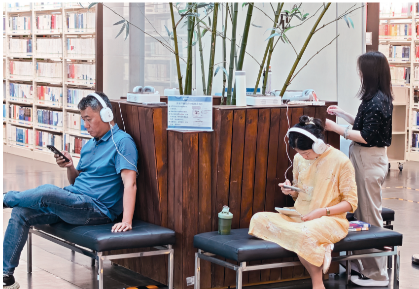
▲广州图书馆影音疗愈空间。

AI技术将成为这里的“隐形疗愈师”,依托前沿科技,空间特别增设音乐创作体验——在专业治疗师的引导下,读者只需输入情绪关键词,即可快速生成专属疗愈音乐。