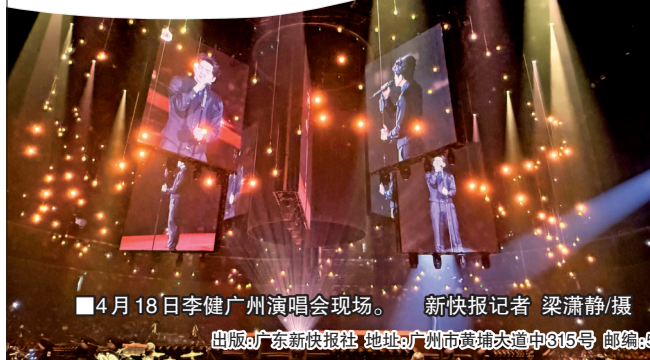
■4月18日李健广州演唱会现场。新快报记者 梁潇静/摄