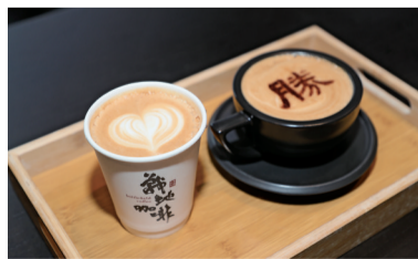
■在黄埔军校旧址,“战地咖啡”以军旅主题营造沉浸式场景。

在增城丝苗米文化公园,一家“村咖”将丝苗米文化融入空间与饮品,用米糠的清香搭配咖啡的醇香,并代售当地丝苗米