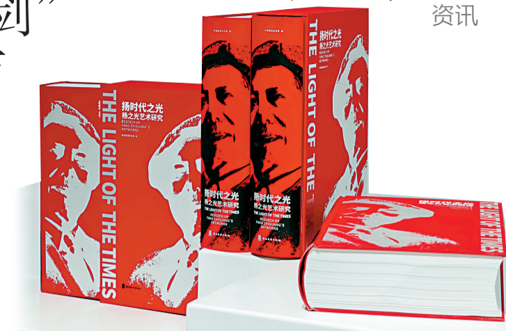
■《杨时代之光·杨之光艺术研究》

广东省文联主席、岭南画派纪念馆馆长李劲堃表示,“杨之光先生过去在研究、教学以及创作方面有非常重要的方