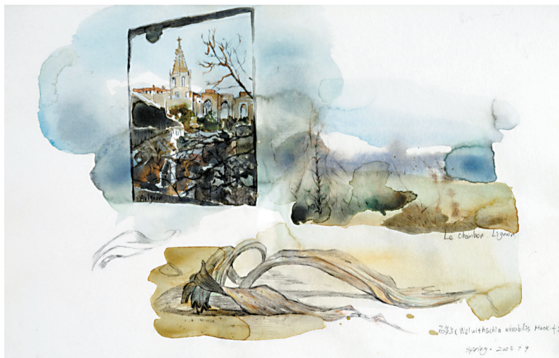
■贺晓春 千岁兰 No.12 纸本水彩

日前,“余烬有痕:贺晓春作品展”在珠海市古元美术馆开幕。贺晓春的作品《睁开眼睛》系列关注的是高龄老人群体。她的母亲也属于高龄老人,每三个月需要提交一张照片——要求老人手拿当日报纸,或坐在正播放《新闻联播》且有当日时间标识的电视机旁——以证明她仍然健在,从而领取相应补助。贺晓春介绍,微信群中上传的照片里,有的老人面带微笑,有的神情木讷或冷漠;更触目惊心的是那些躺在病床上奄奄一息的老人。她认为,“高龄老人承载着生命的尊严,见证了生命过程的重要阶段,他们的存在提醒我们生命的连续性与发展性,以及每个阶段独特的价值和意义。他们不仅是社会的一部分,也是我们反思生命、存在、道德和社会结构的重要窗口。通过观察,以艺术作品记录下高龄老人的晚景,可以更深刻地理解人的本质、生命的价值和社会的责任。”广州美术学院艺术与人文学院院长、教授,本次展览策展人胡斌表示,在当下这个瞬息万变的多媒介传播时