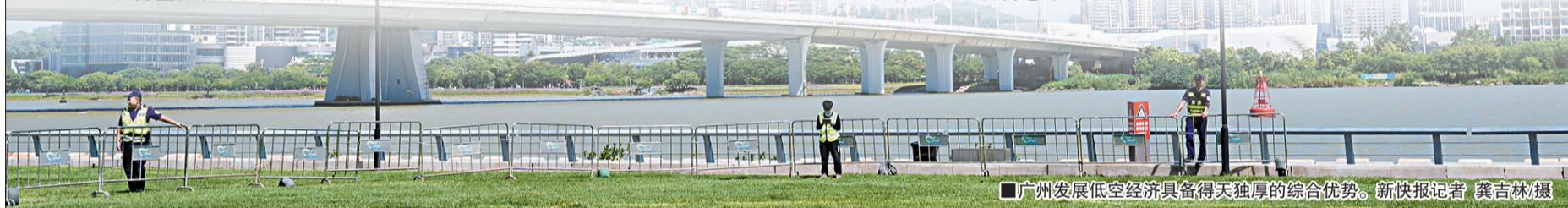
■广州发展低空经济具备得天独厚的综合优势。

将现场气氛推向高潮的是广州空天产业投资基金的正式发布。据悉,该基金目标总规模达200亿元,由市级财政、各级国有企业、政府性基金及金融机构等多方共同出资,投资范围覆盖低空经济与航空航天全产业链,包括关键原材料供应,核心零部件制造,航空器及配套设施以及低空物流、文旅、出行、政务飞行和航空运输、航天发射等应用和服务场景项目,聚焦产业链重点领域和薄弱环节。