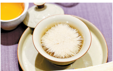
▼甜品豆腐花,心思与刀工集体在线。

◀客的招牌之一“鸽吞鲍”如今已是6.0版本,其中除了南非鲍之外还因应季节时令加了少许藕饼。