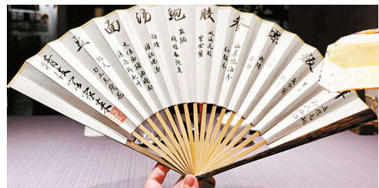
■点选套餐的食客,上菜之前主厨或店经理会手动展示套餐中所用到的全部食材,仪式感满满。

◀咸蛋黄叉烧,出彩之处是猪肉用的是西班牙伊比利亚黑毛猪的五花肉,酿进翻砂的咸蛋黄,一口下去,肥而不腻具象化了。