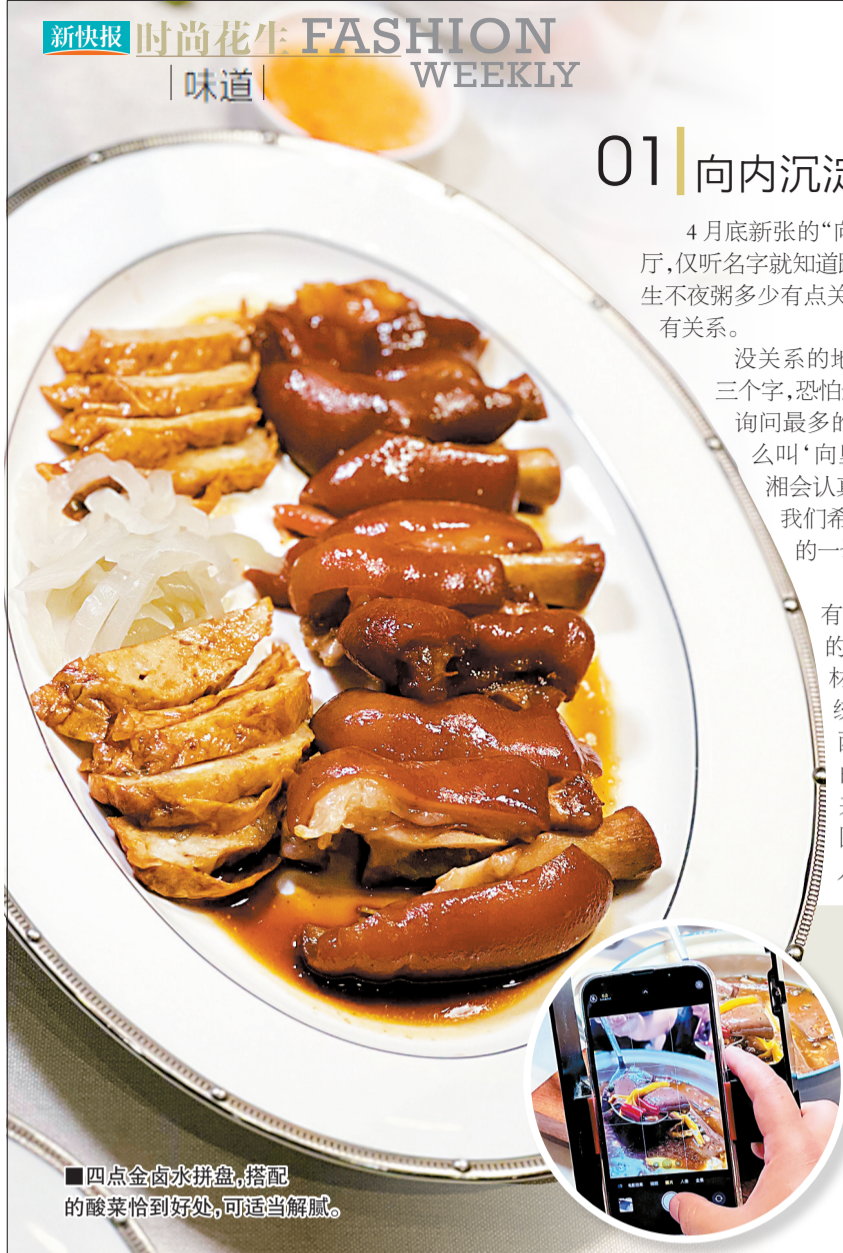
■四点金卤水拼盘,搭配的酸菜恰到好处,可适当解腻。

◀卤水煮鹅血 花椒煲味道很正,还可问店家要一份普宁豆腐加下去,作为受物的它不会让人失望。