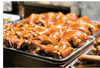
■四点金的诱惑直截了当,直击肉食爱好者的灵魂。