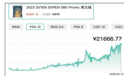
■PSA10“戴灰色毛毡帽的皮卡丘”收藏卡价格走势。

在此背景下,围绕卡牌资产的金融化尝试亦在持续推进。在区块链领域,Courtyard、Collector Crypt 等平台在推