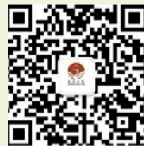
学校微信公众号二维码

广州市增城区荔湖街荔城大道420号(地铁21号线钟岗村站往城区方向约1000米) 邮编:511300