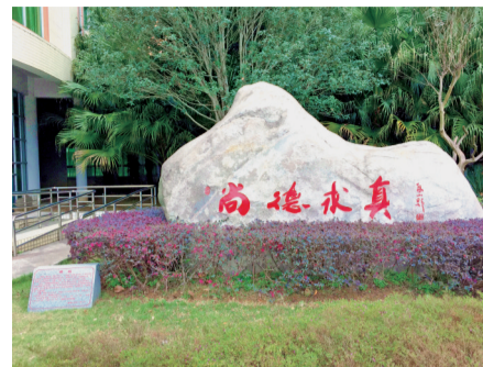
■增中校训——尚德求真