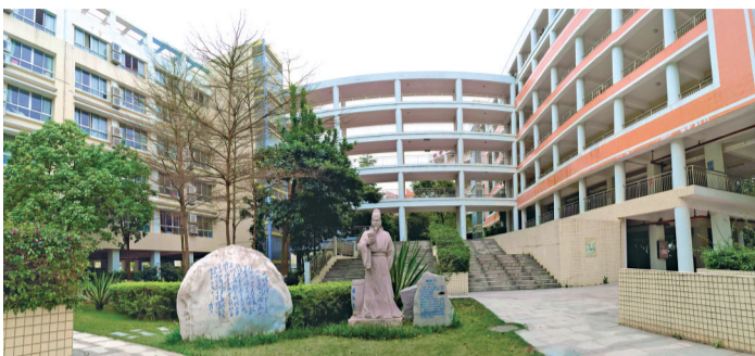
■校园一景——崔与之像

千年学宫,百年增中。增城中学于1928年在宋代学宫旧址兴办,是增城第一所公办新式学校,传承着增城千年文脉。学校于2008年被评为广东省国家级示范性普通高中。学校以“尚德求真”为校训,以“人本·人文·人和”为办学理念,以立德树人根本任务,切实转变人才培养方式,努力构建“五育”并举教育体系,为党育人,为国育才。学校被评为中国教育科学研究院拔尖创新人才培养实验学校、空军招飞优质生源中学,先后荣获全国绿化模范单位、广东省先进集体、广东省工人先锋号、广东省中小学艺术教育特色学校、创建广东省文明校园先进学校、广州市教育工作先进集体、广州市文明校园等荣誉称号。