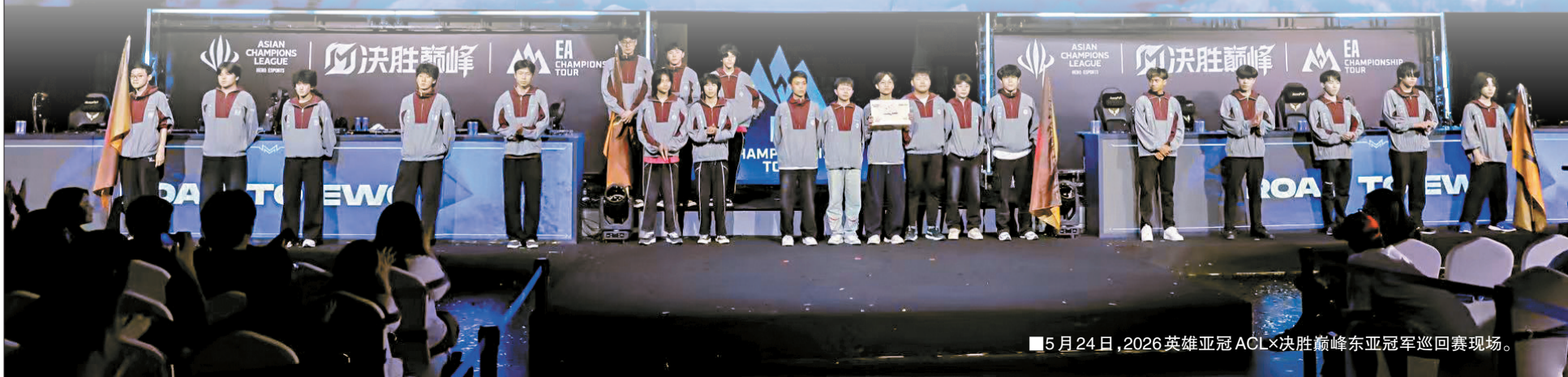
■5月24日,2026英雄亚冠ACL×决胜巅峰东亚冠军巡回赛现场。