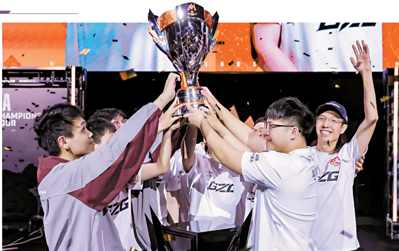
■5月24日,广州电竞队GZG捧起东亚赛区总冠军奖杯。

■统筹:新快报记者 王敌 ■采写:新快报记者 王敌 梁潇静 李应华 陈洁