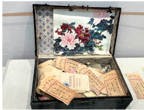
广州华侨博物馆电影道具专题展展出的装信盒子。