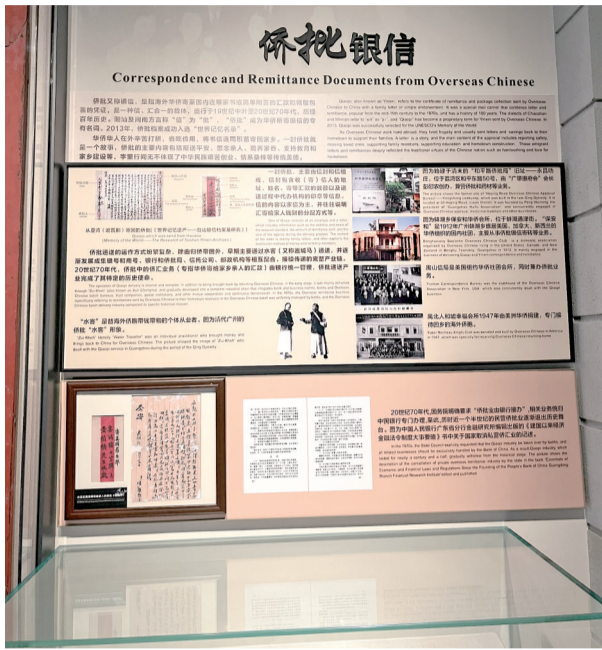
广州华侨博物馆介绍了侨批银信。