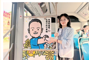
■乘客打卡“家书巴士”。