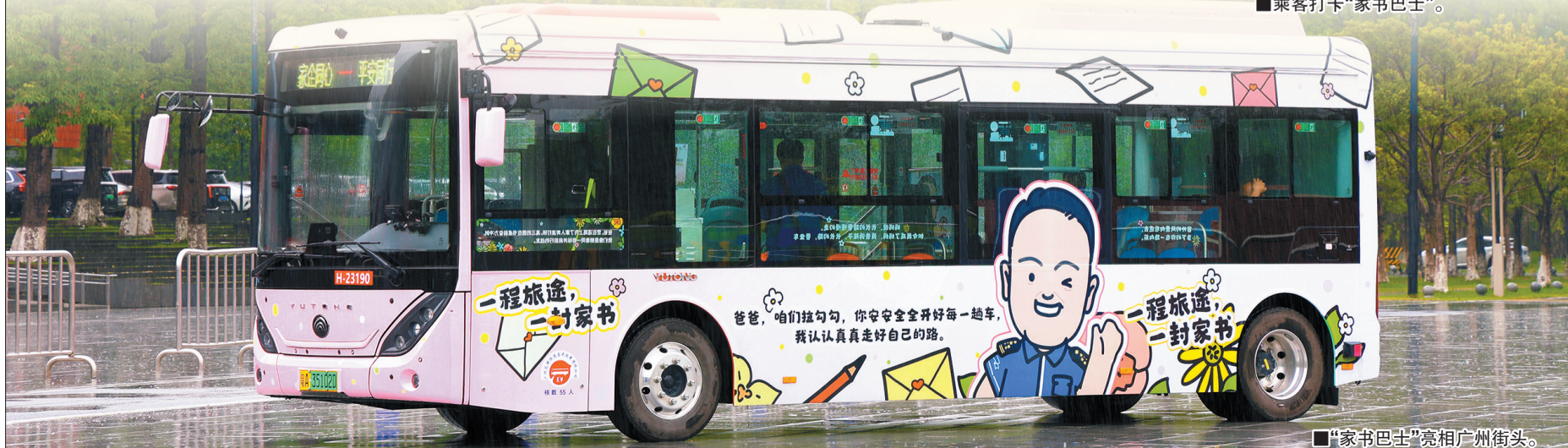
■“家书巴士”亮相广州街头。