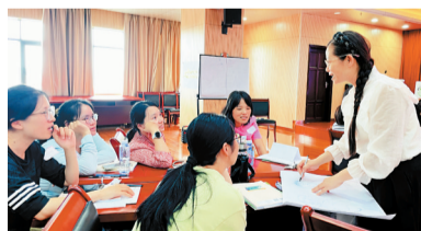
■专业培训在轻松的氛围中进行。

活动中,两名学员代表分别选取“我的身体我做主”和“网络与社交安全”作为授课主题,各自完成了40分钟的完整课堂教学,实现教学相长。两位学员代