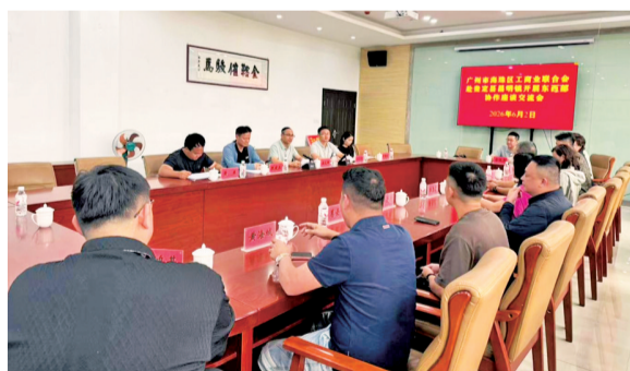
■6月2日,广州市海珠区工商联赴贵定县开展东西部协作交流活动。

为让帮扶真正落到实处、暖到心坎,贵定小组深入昌明镇、沿山镇、盘江镇三个受灾乡镇及安置点,实地走访、细致问需,统计摸排受灾群众的生活及