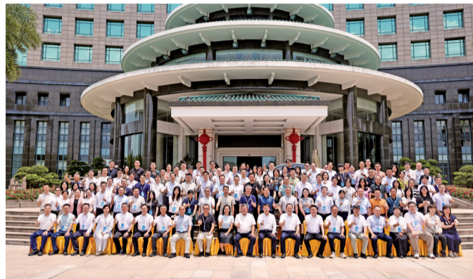
■与会领导与会员代表合影。