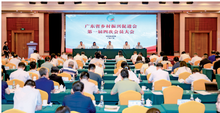
■6月3日,广东省乡村振兴促进会第一届四次会员大会在广州召开。