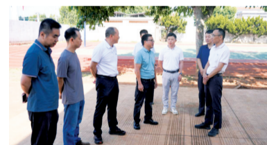
■工作队结合学校学生需求,发挥南沙资源优势,逐步完善提升学校教学条件。

在酷热的教室里上课。工作队及时协调后方帮扶单位捐赠电风扇20台,主要更替迈陈小学已损坏的风扇,在各个教室增添风扇数量,为孩子们送去夏日清凉。