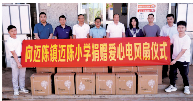
■捐赠电风扇仪式现场。

迈陈小学校长及师生代表对工作队一直以来的关心支持、南沙帮扶单位的爱心捐赠表示感谢。接下来,驻迈陈镇工作队将持续关注乡村教育发展,广泛动员社会各方力量,共同做好教育帮扶工作。