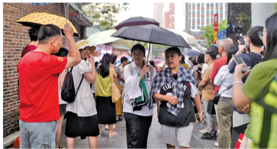
■6月8日下午,英语考试结束时下起小雨,执信中学考点外,不少家长带着雨伞来接考生。

“今天,我来送小儿子参加高考,而8年前,我同样在这里送大儿子走进考场。”广东广雅中学考点外,一位家长神情从容,“虽然今天有点下雨,但不影响我们来接孩子,重要的时刻还是要陪伴。”谈到高考,他坦言自己已不像大儿子高考时那般紧张,不仅是心态上的放松,也感受到广州整体高考氛围越发“松弛”。“现在家长们不像几年前那么在意,觉得高考‘一战定生死’。大家都更放松了,会支持孩子好好备考,但对成绩好坏没那么紧张和较真,孩子尽力就行。”对于今年高考的期望,他表示,孩子能安安稳稳地把高考考完,就算成功。