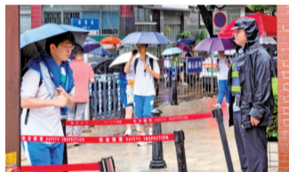
■在广州市第七中学考点雨中坚守,越秀公安民警做好秩序维护和服务保障。