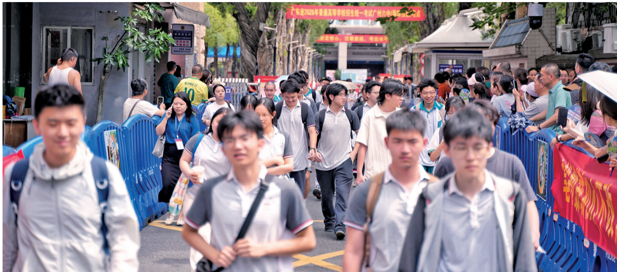
■6月8日上午,广州市第六中学考点,考生结束上午的考试后陆续走出校门口。

■统筹:新快报记者 邓善雯 ■采写:新快报记者 程羽 李应华 林钢威 王娟 徐绍娜 陈钰涵 通讯员 公新文 ■摄影:新快报记者 郭思杰 李应华 部分为通讯员供图