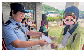
■黄埔区北师大高考考点一名赴考考生不慎忘带身份证,黄埔公安驻点民警为考生办理开具临时身份证明。