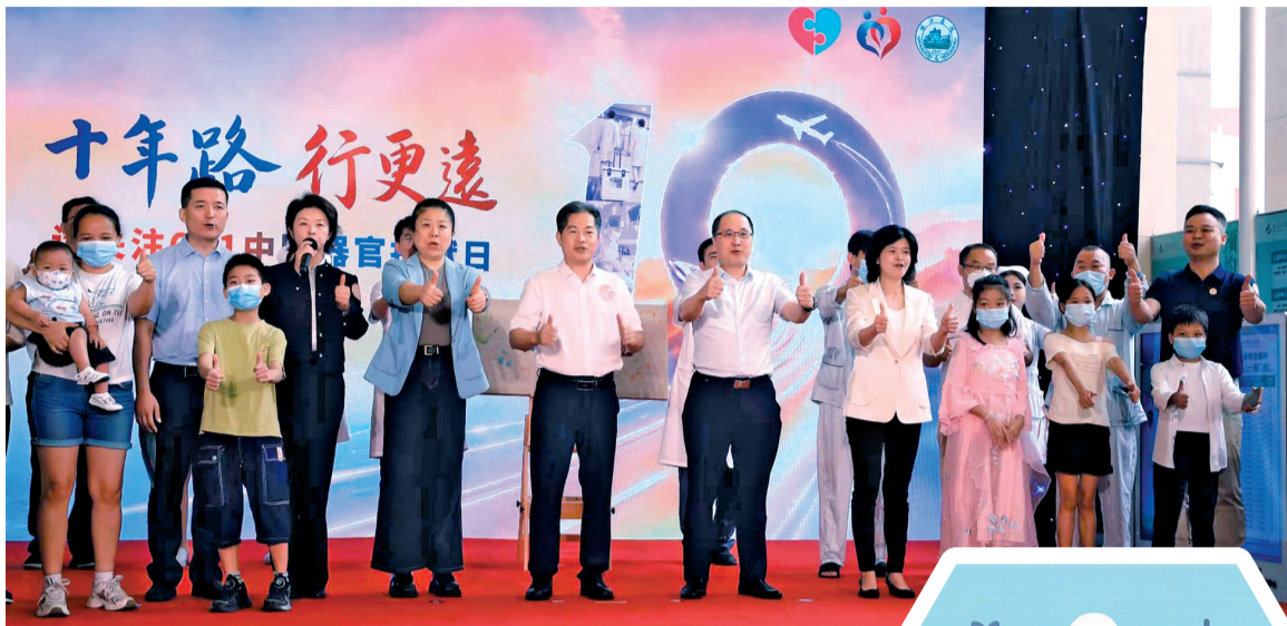
■珠江医院发起“十年路,行更远,请关注‘611’中国器官捐献日”共同倡议,向全社会发出号召,倡导大众科学认识、理解并支持器官捐献,主动加入生命接力队伍。

2026年6月11日,在第十个“中国器官捐献日”到来之际,珠江医院联合12家托管医院及OPO区域协作医院举办“珠江联动十二城·生命接力爱永恒”主题宣传活动。活动上,医院器官捐献志愿服务队通过科普宣讲、家属及志愿者交流等形式,呼吁社会公众科学认识、理解并支持器官捐献,让“生命接力”温暖永续。