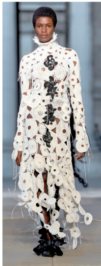
▲轻盈透气的镂空钩编带来松弛简约的魅力及舒适感,全身套装或连衣裙材质拼接均可使用。

►更低调的可将贝壳形状平面化处理,无论印花或压纹,演绎松弛不随意、浪漫不张扬的海岸格调。