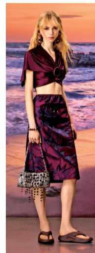
▲暗夜植物印花自带清冷疏离氛围感,纹路细腻立体,层次含蓄高级,凸显低调轻奢质感。

这种碰撞融合构建出别样自然意境,满印设计贯穿无留白、无断层,让穿搭如置身海滨植物园。