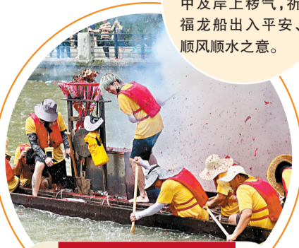
端午期间趁景指南

(受篇幅所限仅按时间排序列出部分,具体或因天气、水势等因素调整的以各地最新公告为准)