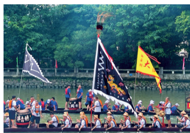
■前来探访的洋塘五约龙船。

斗七星在中国传统文化中可视为最早的自然崇拜之一,实用功能是授时,如表盘上的时针一般,观察北斗转动指向的变化可知季节——斗柄东指,天下皆春;斗柄南指,天下皆夏;斗柄西指,天下皆秋;斗柄北指,天下皆冬,根据斗柄指向还能获知是几月甚至几号,北斗七星也因而被古人视为“天帝”。