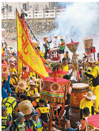
■有“广州第一大龙船景”之称的车陂景。