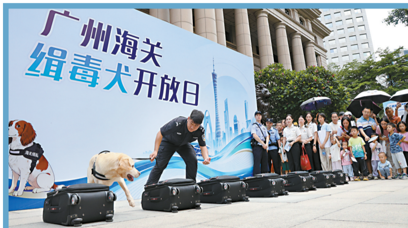
■6月21日,广州海关举办“缉毒犬开放日”活动。

在实验室规范化治理方面,《行动方案》要求,各地要指导学校定期开展安全风险排查,规范妥善保管教学用试剂(药品)中的危险化学品、易制爆危险化学品及易制毒化学品,及时更换有安全隐患的实验器材。校长每学期应不少于2次到实验室指导实验教学安全工作。