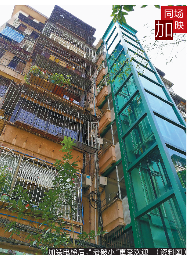
加装电梯后，“老破小”更受欢迎（资料图）

至于建议成立议事协调平台，该负责人表示，广州已有2000多个议事平台分布在社区层面。