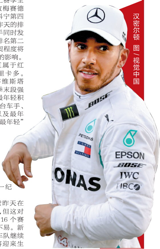
汉密尔顿 图 视觉中国