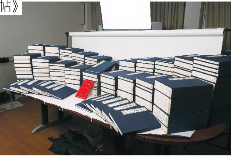
容庚先生生前收藏和珍藏的丛帖学巨献《容庚藏帖》,广东人民出版社刊行

容庚先生出生于晚清书宦世家,在祖辈父辈的熏陶和指导下,从小就喜好金石书画。他的四舅邓尔雅是著名的书法篆刻家,容庚跟随舅父研读《说文解字》、《说文古籀补》深悟金石门径,学习之余研习书法、篆刻,后来师从罗振玉、王国维,对殷周以来甲骨文、彝鼎文字进行过大量的研究。