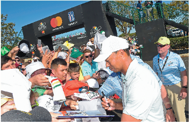
老虎·伍兹总是那么受欢迎

当被问及是否会以队长身份出战时,老虎笑着说:“我从没想过自己这么快就可以当上队长,但是我也认为这是一个完美的时机,在我职业生涯中是一个自然而然的事情。如果我那时候球打得不错,足以球队争得分数,我会很乐意以队长身份出战总统杯,但是我会跟我的副队长和队员商量此事。我在黑泽汀做大卫·拉夫三世的副队长时非常享受,也很喜欢在去年